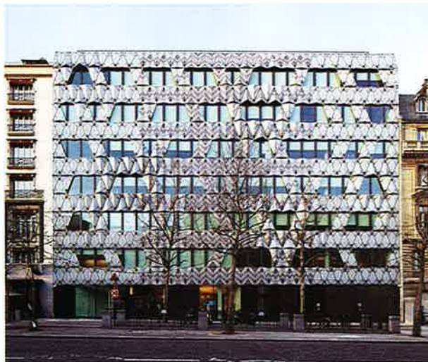
L'origami marbré se décolle progressivement du mur rideau pour créer au centre de la façade un pliage plus serré et saillant.

Conçu pour un investisseur privé, à moins de 200 mètres de l'Arc de triomphe, l'immeuble abrite 300 postes de travail. La vocation emblématique d'un siège social et l'implantation de cette parcelle ont conduit l'architecte à dessiner pour l'édifice une façade sophistiquée ouverte sur le quartier. Constituée d'un mur rideau à double vitrage, elle est couverte d'un origami marbré assurant la visibilité du bâtiment. Cette peau translucide, évoquant l'albâtre, est faite d'un assemblage de panneaux en double feuillet de verre sérigraphié fixés à une structure en aluminium thermolaqué. L'utilisation d'une sérigraphie plutôt que d'un véritable marbre a permis de décliner la teinte des bâtiments mitoyens sur les plaques et d'y maîtriser la position des veines. Suivant un assemblage « à livre ouvert », leur mise en œuvre est une référence aux calepinages historiques jouant avec les motifs du matériau pour former des décors non figuratifs. Le long des 30 mètres de la façade, l'origami brise-soleil préserve un peu de l'intimité des usagers en offrant un maximum de lumière naturelle dans la bande bâtie. Déjouant la monotonie anonyme du mur rideau sur lequel elle s'applique, cette luxueuse vitrine identifie l'édifice auprès du public et de ses usagers.