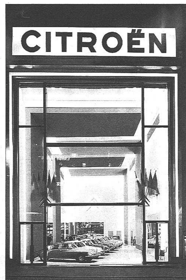
Citroën har været repræsenteret på adressen Champs-Élysées 42 siden slutningen af 1920'erne.

år, kunne forsyningerne af byggematerialer og stålkonstruktionerne bag husets ydre glasoverflade kun ankomme mellem kl. 1 om natten og 6 om morgenen.