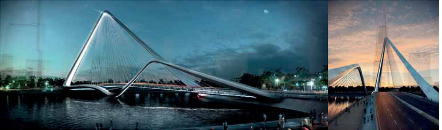
INFINITY LOOP BRIDGE / ZHUHAI / CHINA www.10design.co

A equipa formada pelo gabinete de arquitetura 10 e os engenheiros da Buro Happold acabam de superar as propostas dos 16 gabinetes de consagrados, todos eles participantes no concurso internacional para uma ponte de 300 m que anunciará a entrada no Shizimen, novo bairro comercial planeado para o sul da China. De design simples e elegante, o projeto – que se prevê estará concluído em 2014 –, resulta numa estrutura ondulante de cabos que envolvem um conjunto de seis faixas de rodagem e caminhos pedestres. O loop gerado pelos dois arcos triangulares define o impacto visual e o dramatismo paisagístico na interceção entre o canal e o delta do rio das pérolas. Segunda e terceira foram as posições alcançadas pela equipa para duas outras pontes secundárias ao longo do canal.