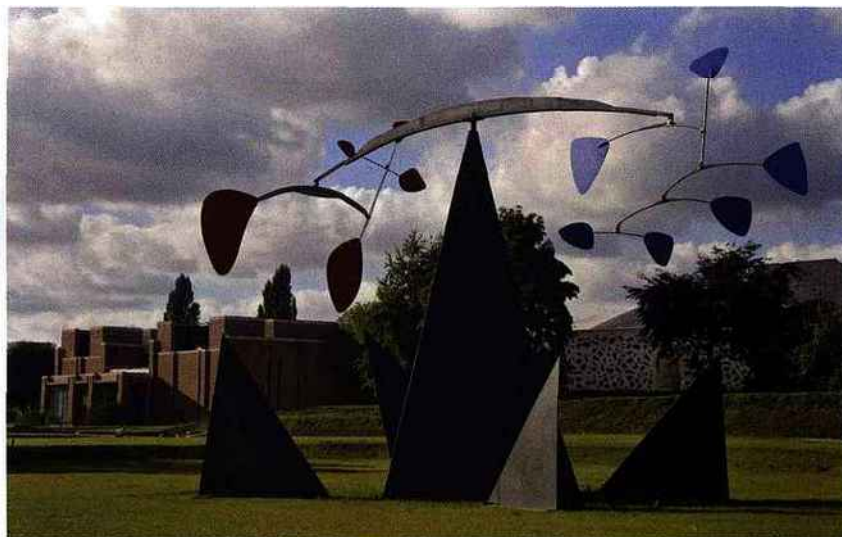
Vues extérieures et intérieures du LaM © Max Lerouge / LMCU © Manuelle Gautrand Architecture © Calder Foundation, New York / Adagp Paris, 2010