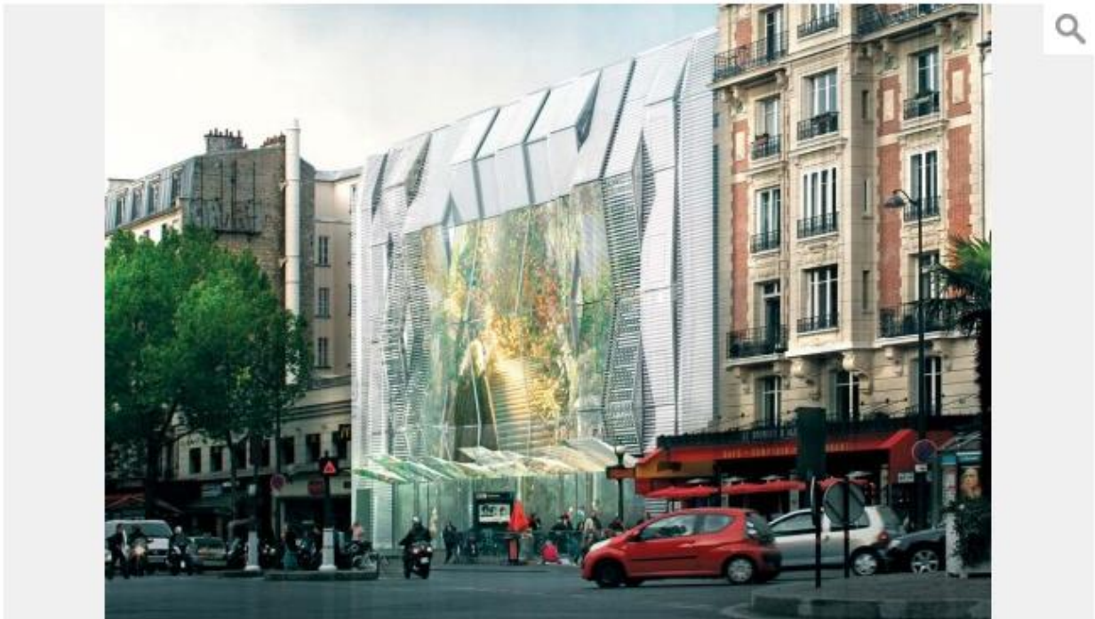
Métamorphosé par l'architecte Manuelle Gautrand, le cinéma rouvrira en 2016.

Le cinéma qui avait été d'abord construit en 1921 sur ce carrefour animé a déjà connu de multiples transformations profondes et autres rénovations, jusqu'à ce que le groupe Gaumont-Pathé engage, il y a quelques années, dans la capitale plusieurs projets pour rendre ses salles devenues vieillottes plus conformes aux attentes du public actuel. Outre le Gaumont Alésia, sont aussi en chantier celui de Convention, dans le XV e arrondissement, qui sera reconstruit par Jean-Pierre Buffi avec AIA Associés, et le Gobelins-Fauvettes, dans le XIII e , dont le projet a été confié à l'agence Loci Anima.