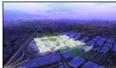
VALODE & PISTRE 01 - VUE ARIENNE

Pour les architectes norvégiens du cabinet Snohetta, il s'agit de créer une nouvelle urbanité, en lien avec le centre urbain et la périphérie rurale. Le concept réunit les formes d'agriculture urbaine, telles que les parcelles privées, la cueillette par le consommateur et la production de biocarburants. Le poids de la structure imaginée, ajouté à celui de la terre agricole, devrait former une masse thermique ainsi qu'une isolation sonore qui protège le site et diminue les besoins énergétiques.