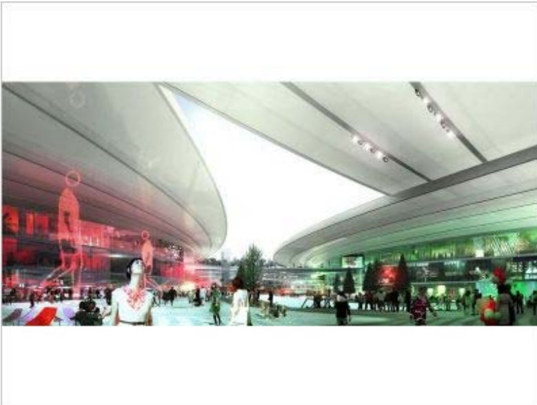
Manuelle Gautrand Architecture ©