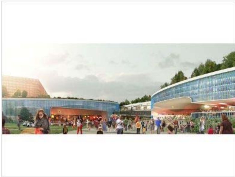
Manuelle Gautrand Architecture ©

"Constitué de sept séquences qui s'emboîtent les unes dans autres comme des volutes, le projet prend son origine au droit de la gare Grand Paris Express / RER qu'il finira par envelopper. Puis, il traverse le boulevard urbain, par-dessus et par-dessous, et enfin se glisse sur le site au sud en s'y épanouissant, dans une grande continuité paysagère et d'usages".