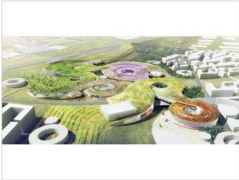
Manuelle Gautrand Architecture ©

"Notre proposition incruste le projet dans la coulée verte imaginée par Mathis Güller dans le plan de référence du Triangle de Gonesse : c'est un projet-paysage qui coule sur le site du nord au sud, qui s'enroule tantôt par-dessus, tantôt par-dessous cette coulée verte", explique Manuelle Gautrand.