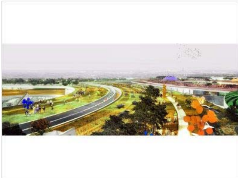
Manuelle Gautrand Architecture ©