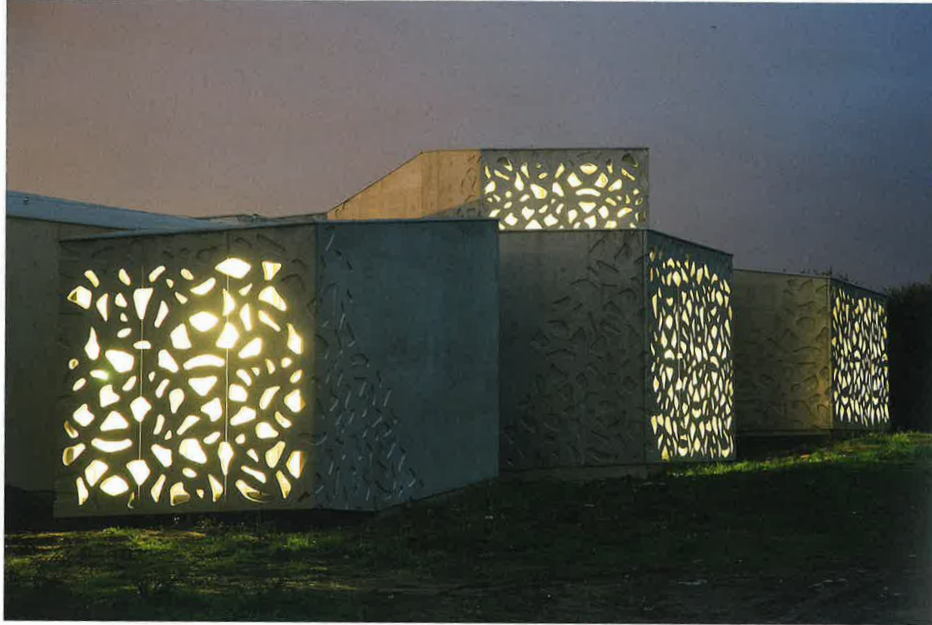
LAM - LILLE MÉTROPOLE MUSÉE D'ART MODERNE, D'ART CONTEMPORAIN ET D'ART BRUT